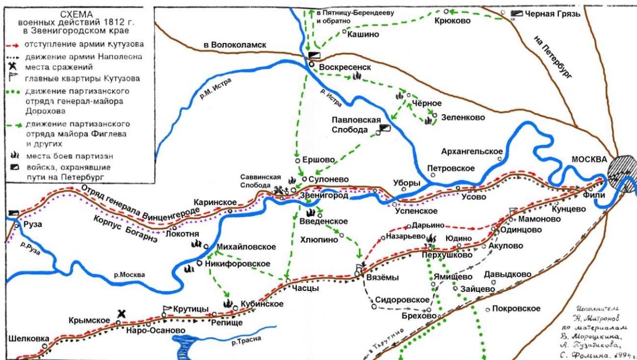
Схема 2. Боевые действия в Одинцовском районе.